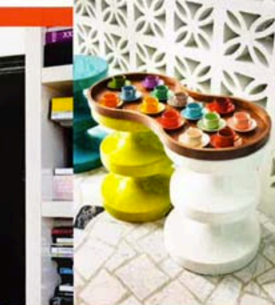
DE ARRIBA ABAJO, TAZAS DE INDIA PARA ATELIERS BUFFLE; SOFÁ JET LAS JUNTO A MESITA VERA CRUZ CON LÁMPARA GAMMA Y CERÁMICA. ENCIMA DE LA BUTACA OLIVER, FOTO ANÓNIMA. LA LÁMPARA SHADOWS Y LA MESITA RIVINGTON TAMBIÉN SON DE DISEÑO PROPIO. MOQUETA DE DAVID HICKS.

de las telas. Me divierte especialmente combinar los dibujos geométricos con los floreados. Tengo una amiga que siempre dice que hago combinaciones que no pegan pero que funcionan. No me complico con las mezclas, simplemente busco que el resultado sea armonioso". Solo trabaja con artesanos para fabricar sus taburetes de cerámica, sus lámparas retorcidas y sus sofás cálidos. "Mis muebles son amables y cercanos porque no son industriales, todo lo hacemos manualmente", remata India. Esta mujer cosmopolita, que nació en Teherán de madre escocesa-egipcia y padre iraní, y pasó su infancia en Massachusetts, Alemania y Francia, odia las bolsas de plástico, le encanta dormir y pasar tiempo en la cocina, "el corazón de mi casa". Se considera maximalista y acaba de terminar su residencia de vacaciones en Siwa, en mitad del desierto egipcio, hecha con barro, conchas y cantos rodados. Sus grandes aciertos decorativos también están fuera: los hoteles Candela D'E en México, el Townhouse en Miami o el neoyorquino On Rivington . Como muchos otros nomadas, India eligió París como punto de referencia. En 1999 abrió aquí su primer estudio de interiorismo en el número 5 y ahora renueva iboom en el portal de al lado. Su último trabajo, el hotel Thoumieu , también está en la ciudad del Sena. Para que la vitalidad no se le disperse. ■ www.india-mahdavi.com