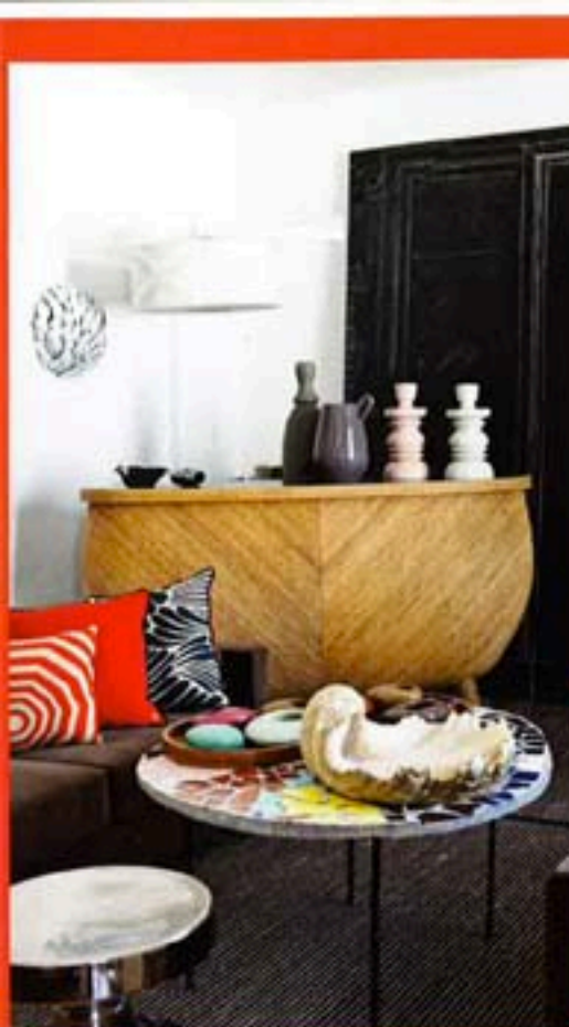
SOBRE EL MUEBLE BAR CUBA LIBRE, CERÁMICA SMOKING NO SMOKING DE INDIA MAHDAVI Y MESITA VINTAGE. DEBAJO, BIOMBO, MESITAS SUNNY WEEK END, SOFÁ JELLY PEA Y LAMPARA KARABA, TODO DE INDIA. A LA DCHA., BUTACA CAP MARTIN DE LA DISEÑADORA.