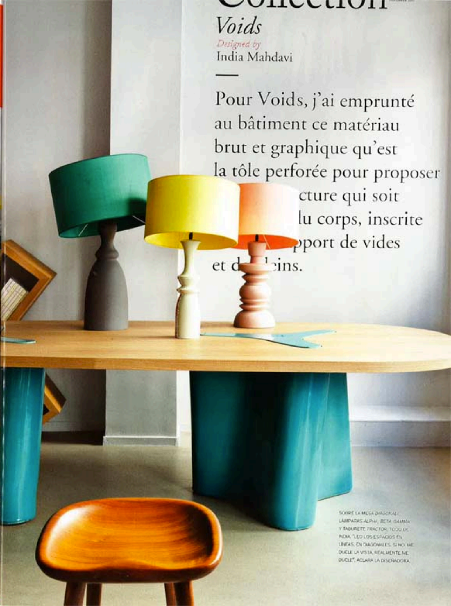
SOBRE LA MESA DIAGONAL, LÁMPARAS ALPHA, BETA, GAMMA Y TABURETE TRACTOR, TODO DE INDIA. "LEO LOS ESPACIOS EN LINEAS, EN DIAGONALES. SI NO ME DUELE LA VISTA, REALMENTE ME DUELE", ACLARA LA DISEÑADORA.

Pour Voids, j'ai emprunté au bâtiment ce matériau brut et graphique qu'est la tôle perforée pour proposer une structure qui soit au corps, inscrite dans l'espace et en rapport de vides et de pleins.