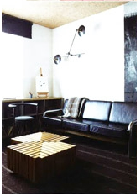
SKETCH. L'impression de tenir salon dans une galerie d'art en plein West End. Fabuleux à plein d'égards (la salle The Gallery dont le design a été confié à India Mahdavi ou le salon The Glade, où l'on déguste thé et comfort food), le restaurant est surtout la première expérience internationale du chef étoilé Pierre Gagnaire. 2 Conduit Street, London W1K 2EG.

THE CHILTERN FIREHOUSE. Cette ancienne caserne de pompiers est le premier projet londonien d'André Balazs, roi de l'hôtellerie fashion. Et un nouveau repaire pour les paparazzis. L'endroit est idéal pour dormir, dîner, ragoter ou prendre un verre non loin de supermodels (Kate Moss, Naomi Campbell...) ou de politiciens comme David Cameron. 1 Chiltern Street, Marylebone, London W1K 7EA.