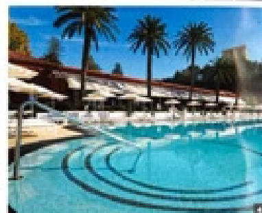
Solltet bis ins Detail: „Monte-Carlo Beach Hotel“: 1 Rundbauvorteil. Alle Zimmer bieten schönsten Meerblick. 2 Junior Suite. 3 Exclusive Room. 4 Poolrestaurant „Le Deck“. 5 Lobby-Bar.

DZ ab 266 €/Nacht (im März). Reservieren unter Resortlib.com oder 00377 98964151.