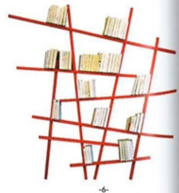
1/ Rangement mural Fausto, design Benoît Convers, 1250 €. Collection « Mobilier de compagnie » chez Ibride 2/ Étagère De Coin, design Marie Dessuant, 723 €. Cinnà 3/ Bibliothèque Reservoir Dog, 7800 €. India Mahdavi 4/ Étagère Gunshelf, 950 €. Alain Marzat 5/ Bibliothèque Tree Branch, 5400 €. Studio Olivier Dollé 6/ Bibliothèque Mikado, design Jean-François Bellemère, 719 €. Compagnie