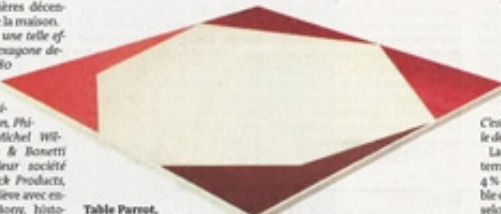
Table Parrot, d'India Mahdavi, pour Petite Friture. 111