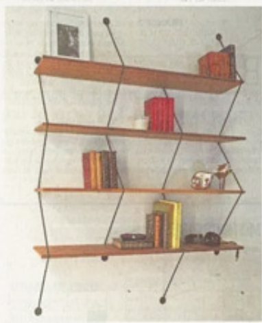
Etagères Clim de Bashko Trybek pour La Chance. 111