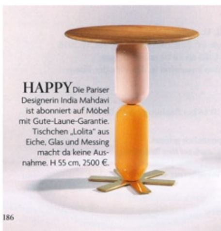
HAPPY Die Pariser Designerin India Mahdavi ist abonniert auf Möbel mit Gute-Laune-Garantie. Tischchen „Lolita“ aus Eiche, Glas und Messing macht da keine Ausnahme. H 55 cm, 2500 €.

Im Holzofen gebrannt und von Hand mit glücks-brin-genden Pflaumen-blüten bemalt: Teller „Ume-jimon“ aus Arita-Porzellan. Von Gen-Emon, 160 €.