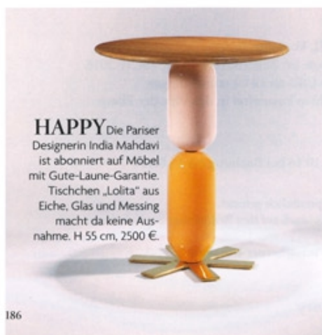
HAPPY Die Pariser Designerin India Mahdavi ist abonniert auf Möbel mit Gute-Laune-Garantie. Tischchen „Lolita“ aus Eiche, Glas und Messing macht da keine Ausnahme. H 55 cm, 2500 €.

Im Holzofen gebrannt und von Hand mit glücks-bringenden Pflaumenblüten bemalt: Teller „Ume-jimon“ aus Arita-Porzellan. Von Gen-Emon, 160 €.